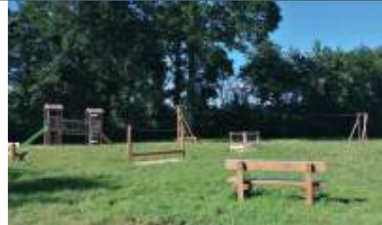
Jeux dans les Landes