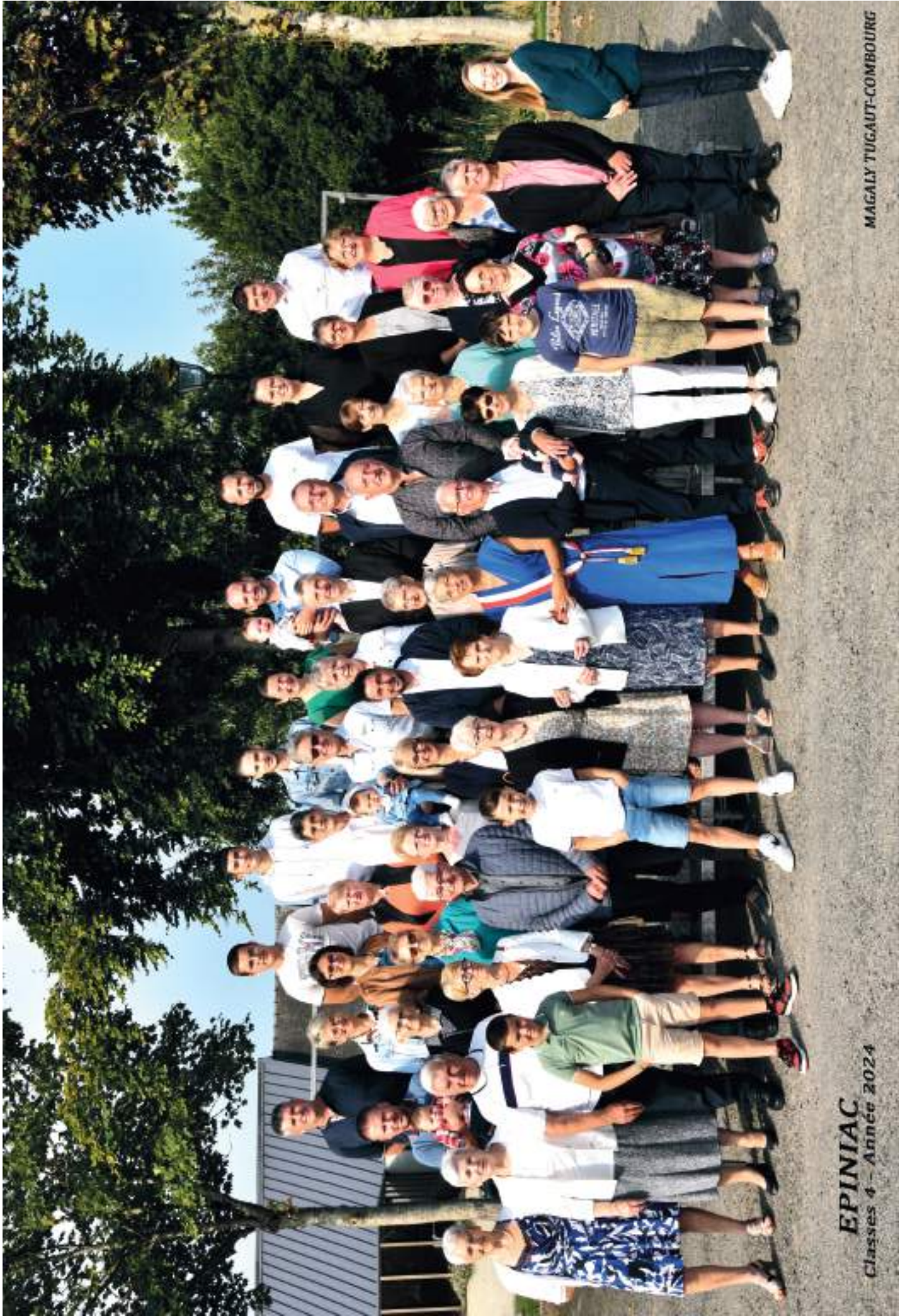
EPINIAC Classes 4 - Année 2024