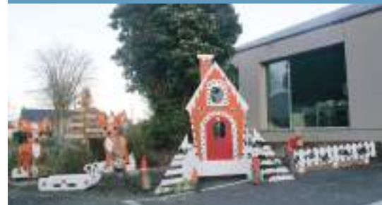
Décoration de Noël